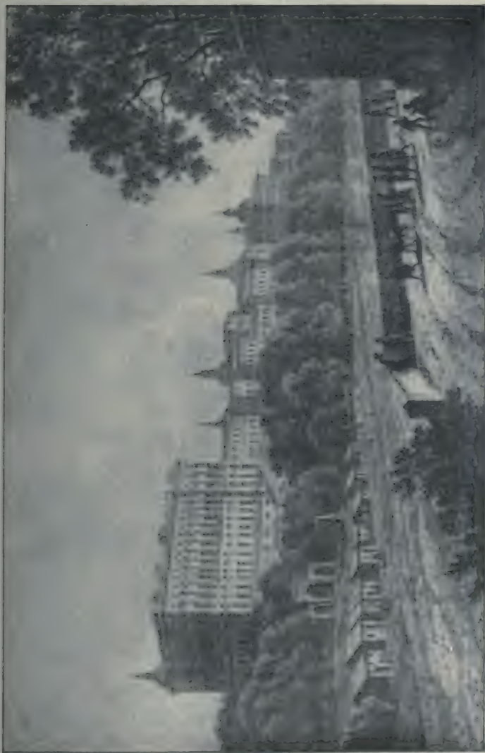
Le Palais du Roi à Madrid.

Dessiné par Bacler d'Albe. Lithographie de G. Engelmann. (Bibliothèque Nationale. Estampes.)